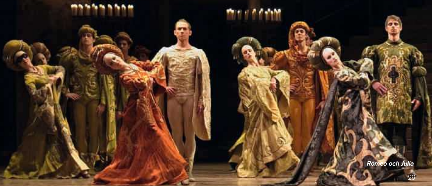
Romeo och Julia